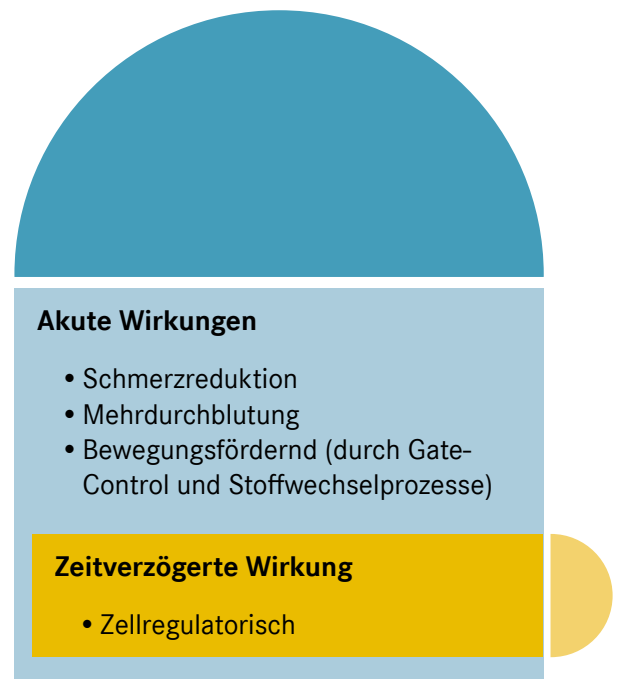
Abbildung 2: Wirkungseintritt der ESWT