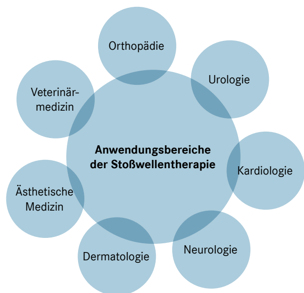
Abbildung 1: Anwendungsbereiche der SWT

Die ESWT wird in zwei Gruppen unterteilt, die fokussierte und die nicht-fokussierte Stoßwellentherapie (Alvarez, 2022). Die fokussierte Stoßwellentherapie gliedert sich in drei Typen, die Elektrohydraulische, Elektromagnetische und die Piezoelektrische. Die nicht-fokussierte Stoßwelle wird in der Praxis radiale Stoßwelle genannt, erreicht jedoch nicht die physikalisch vorgegebenen Para-